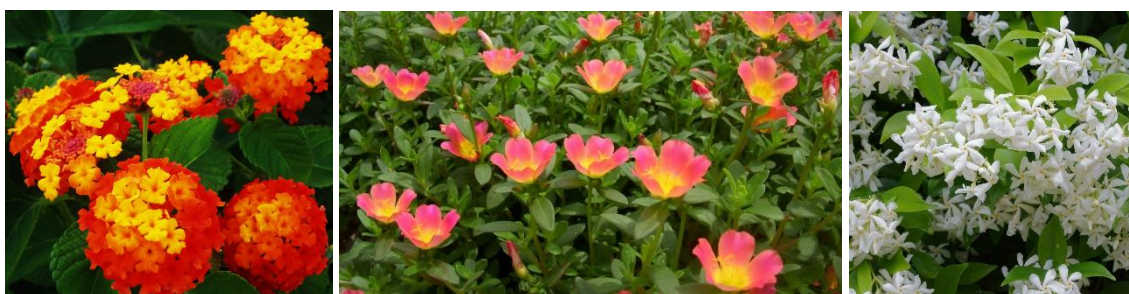
Mudas para jardineira. Respectivamente: Lantana, onze-horas e jasmim.

Os canteiros serão forrados por grama esmeralda. Os localizados em torno dos pergolados, receberão também mudas de bouganville, tutoradas para que subam e cubram as pérgolas. Os demais, terão mudas de árvores de pequeno e médio porte, ideais para sombreamento urbano, como ipê, pata de vaca, quaresmeira, todas com floração abundante e boa adaptação ao clima. As jardineiras dos bancos também receberão mudas apropriadas para o clima a e insolação constante, que demandem pouca manutenção e que não possuam espinhos ou pontas que possam ferir, como onze-horas, jasmim, lantana. É válida a tentativa de aproveitamento das mudas de árvores já existentes no local, caso estejam em condição de serem transplantadas.